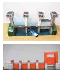
パーパークラフト