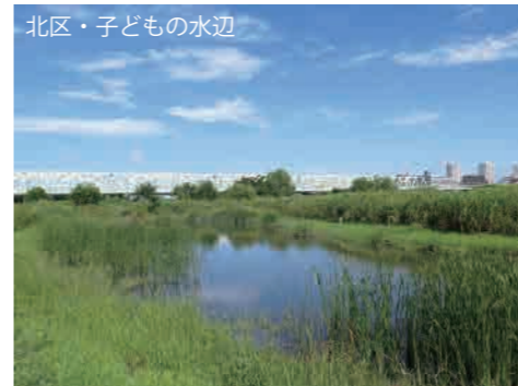
北区・子どもの水辺 荒川知水資料館より徒歩20分 南北線「赤羽岩淵駅」より徒歩15分 JR「赤羽駅」より徒歩20分

荒川の河川敷にある「北区・子どもの水辺」には、水辺や草はらなどの豊かな自然があり、植物や鳥などの観察のほか、魚やカニ、昆虫などの採集を体験することができます。