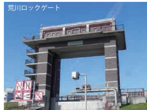
荒川ロックゲート 都営新宿線「東大島駅」小松川口より徒歩10分 ※専用駐車場はありません。公共交通機関をご利用ください。 〒132-0034 東京都江戸川区小松川1地先

近隣に「江東区中川船番所資料館」があります。荒川ロックゲートから徒歩12分です。