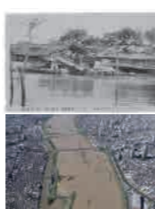
写真画像