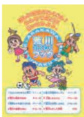
荒川わくわくブック