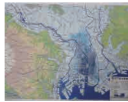
立体模型 (各学校につき1部提供)