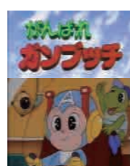
がんばれガンブッチ DVD