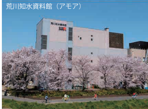
荒川知水資料館（アモア） 入館無料 南北線「赤羽岩淵駅」または「志茂駅」徒歩約15分 JR「赤羽駅」徒歩約20分 都営バス「岩淵町」または「志茂2丁目」徒歩約15分

荒川知水資料館では、「荒川の歴史」「水防災」「荒川の自然」について、子ども達の主体的・対話的な深い学びを支援します。