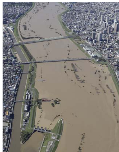
令和元年東日本台風で増水した荒川

5 荒川のダムにおける対策 荒川上流部の二瀬ダムや浦山ダム等で実施されている対策について紹介します。また、各ダムの紹介パネルの展示やPR動画等を放映します。