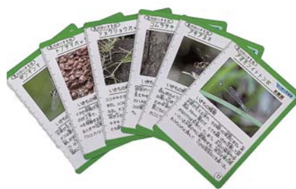
荒川のいきものカード